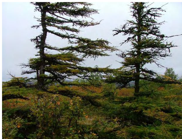
Barskogen i Kolyma-landet består mest av lerketrær