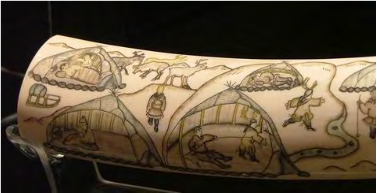
Gravering i hvalrosstann, episoder fra det tradisjonelle dagliglivet, evensk kunsthåndverk, historisk museum