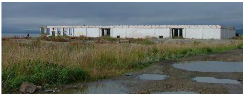
90-tallets ruiner av et fiskemottak nær Ola