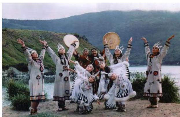
Evenk nasjonalensemble "Ener"

Ansiktene i byen er mest russiske – russere og ukrainere – som danner flertallet her som i de fleste av landets store byer. Men det er en liten andel – noen få prosent – som har asiatiske, tungusiske trekk, som tilhører folkegruppene som ellers bor rundt omkring i Kolyma-landet, og som har bodd her i årtusener før russerne kom. De er evenere, tsjuktjere, korjakere, og andre. Det er evenerne som er den opprinnelige befolkningen i store deler av fylket.