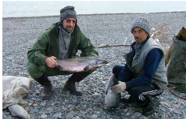
Kystfiske er hovednæringen i landsbyene ved havet – forfatteren med en evensk fisker ved landsbyen Arman