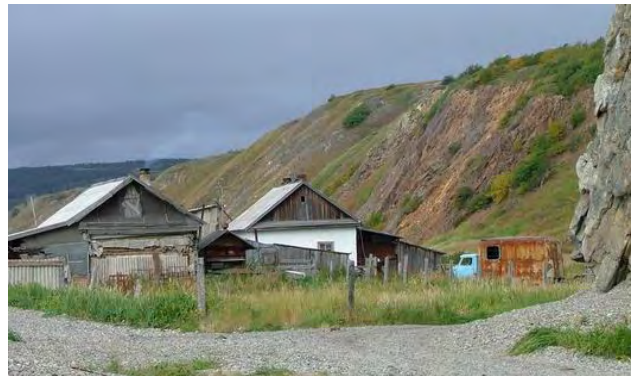
Fiskerhus på stranden nær Ola

En ny administrativ støtteordning skal være en økonomisk støtte for små foretak, men støtter i virkeligheten bare de som fra før er produktive. "Det er ingen sjans for de fleste av de små urfolksbedriftene å komme inn under denne støtteordningen. Det er ikke gått opp for administrasjonen at det er oss – evenere, tsjuksjere, korjakere – som har eid dette landet i manns minne," får jeg høre. Og at det naturlig oppfattes som mer enn urettferdig når den nye russiske administrasjonen tar seg til rette, fordeler ressursene blant seg selv, og lar landets urbefolkning leve i arbeidsledighet.