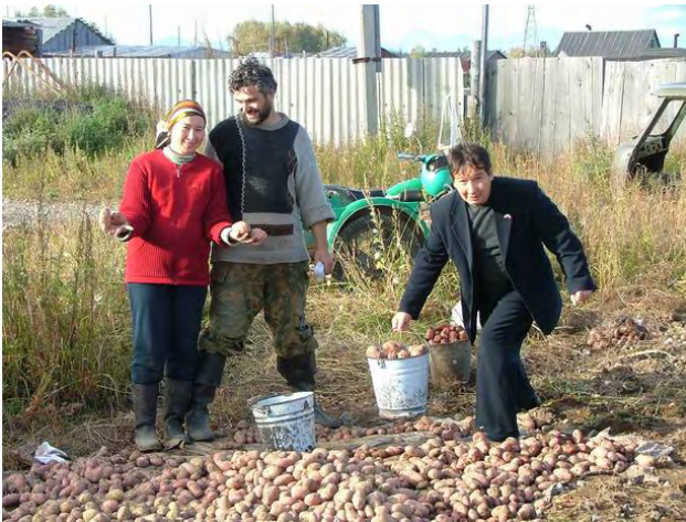
Folk forsyner seg selv med alt de kan