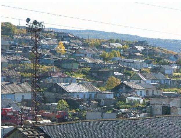
"Shanghai" i Magadan

Etter et stort befolkningstap på 90-tallet har byen igjen vokst noe de seneste årene og har over 160 000 innbyggere. Det er folk fra sentrale Russland som skal tjene penger her. Magadan er en spesiell økonomisk sone med lave skatter og høyere lønninger. Man vil få investeringer hit. Fortsatt er mye slitt, husfasader som ikke er pusset opp, lekeapparater som er gjennomrustne. I sentrum har det skjedd mye og stedvis begynner det å ligne en moderne by. Utenfor sentrum imidlertid, nedover mot Nagaeva bukta, ligger "Shanghai", en bydel med gamle russiske eneboliger – tildels slumhytter – som gir et nokså rotete og fattig inntrykk.